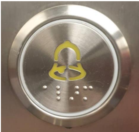
ภาพปุ่มกดสัญลักษณ์ “ระฆัง” เพื่อขอความช่วยเหลือ

วัตถุประสงค์ 1. เพื่อให้ผู้ประสบเหตุสามารถช่วยเหลือตัวเองเบื้องต้นได้ 2. เพื่อป้องกันไม่ให้ผู้ประสบเหตุและทรัพย์สินไม่ได้รับความเสียหายและอันตราย บทสรุปองค์ความรู้ ลิฟต์ในปัจจุบัน เป็นปัจจัยที่สำคัญในการขนหรือเคลื่อนย้ายสิ่งของ ผู้พักอาศัยและการทำงานในตึกที่มีความสูง รวมถึงเป็นสิ่งจำเป็นในการอำนวยความสะดวกแก่ผู้พิการแทนใช้บันได ในการใช้ลิฟต์ในบางครั้งอาจพบปัญหาลิฟต์ค้าง บทสรุปองค์ความรู้นี้ถูกจัดทำขึ้นเพื่อนำเสนอ ขั้นตอนในการปฏิบัติเบื้องต้นเมื่อพบกับสถานการณ์ลิฟต์ค้าง ดังนี้ 1. เมื่อตกอยู่ในสถานการณ์ลิฟต์ค้างเป็นธรรมดาที่จะทำให้รู้สึกตกใจ ตื่นตระหนก อันดับแรกที่ต้องทำคือตั้งสติ และคิดหาวิธีเอาตัวรอดต่อไป 2. ปัจจุบันลิฟต์ทุกตัวจะมีพัดลมระบายอากาศ กรณีที่พัดลมไม่ทำงานให้คล้ายเสื้อผ้าให้หลวมๆ เพื่อช่วยในการระบายอากาศ 3. ห้ามนั่ง หรือนอน เนื่องจากปริมาณก๊าซคาร์บอนไดออกไซด์ที่มีอยู่มากในบริเวณพื้นที่(เนื่องจากหนักกว่าอากาศ)จนทำให้เกิดอาการหายใจไม่เพียงพอได้ ทางที่ดีที่สุดควรยืนเอาหลังชิดผนังลิฟต์ไว้ระหว่างที่รอเจ้าหน้าที่มาช่วยเหลือ Fun Fact: เมื่อไรที่ขาดออกซิเจนเพื่อใช้ในการหายใจ เพียงแค่ 4 นาที ก็ทำให้เกิดภาวะสมองขาดออกซิเจน หรือสมองพร่องออกซิเจน จนทำให้เซลล์สมองตาย เกิดความพิการทางสมอง จนทำให้การทำงานของสมองผิดปกติไปตลอดชีวิตได้ 4. ภายในลิฟต์จะมีปุ่มกดที่มีสัญลักษณ์ “รูปประฆัง” เพื่อขอความช่วยเหลือ ในกรณีที่ไฟดับให้ใช้วิธีการตะโกนหรือทุบประตูเพื่อขอความช่วยเหลือจากภายนอก