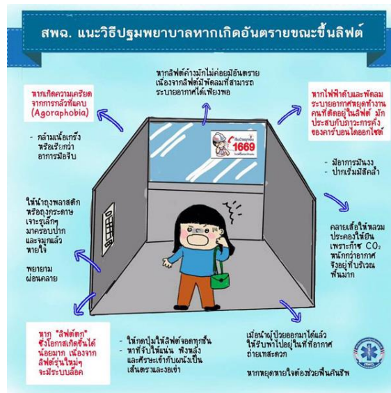
ภาพจากสถาบันการแพทย์ฉุกเฉินแห่งชาติ